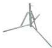
ped 9 kg