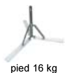
ped 16 kg