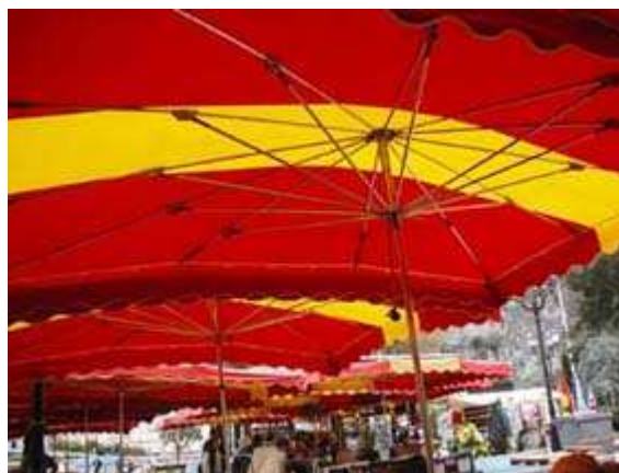
des couleurs éclatantes !