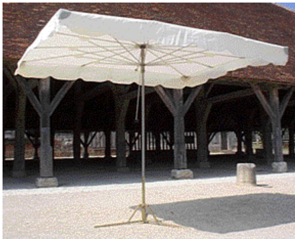
PARAPLUIE DE MARCHÉ 2.5m x 3m