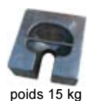
pois 15 kg